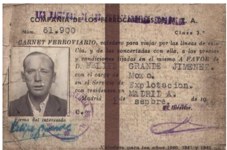
Carnet de Renfe del pare d'Ana Grande